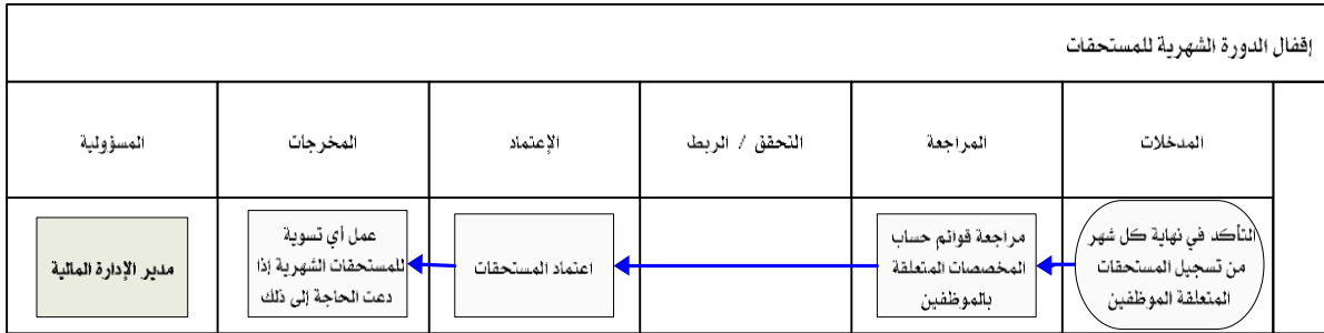
شكل رقم / ٥

يوضح المخطط البياني التالي ( شكل رقم/٥) طريقة تسلسل العمل لإقفال الدورة الشهرية للمستحقات: